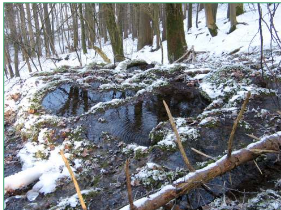
Eine Besonderheit: terrassenförmige Kalktuffquelle

vorragende Wasser- und Nährstoffversorgung sorgt in diesen Bereichen für üppiges Wachstum der Kraut- und Strauchschicht. Ganz anders die Hochflächen, wo landwirtschaftliche Nutzung und für den Naturschutz sehr wertvolle Trockenrasengesellschaften das Landschaftsbild bereichern. Markante Kalkfelsen und großflächige, gut ausgeprägte Blockschutthalden mit Blockschuttwäldern und offenen Kalkschuttfluren sind weitere landschaftliche Höhepunkte. Seine wichtigste Bedeutung hat das Gebiet als Rückzugsraum für viele, auch z.T. seltene Tier- und Pflanzenarten. Besonders zu erwähnen sind dabei die Groppe, eine Fischart mit hohen Ansprüchen an die Wasserqualität und die Grüne Keiljungfer, eine in Bayern stark gefährdete Libellenart. Die zahlreichen Quellen sind ein weiteres Charakteristikum der Täler und, wenn sie als (terrassenförmige) Kalktuffquellen ausgebildet sind, als Lebensraum für eine wiederum sehr spezialisierte Tier- und Pflanzenwelt unersetzlich. Ein dichtes Wegenetz ermöglicht es sich die Naturschönheiten zu erwandern.