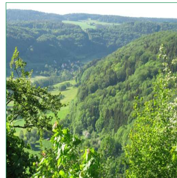
Blick vom Jungfernsprung ins Kainsbachtal