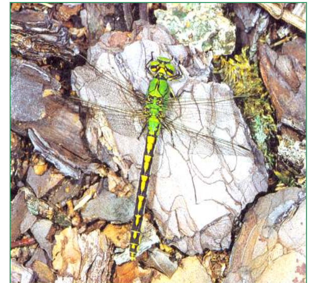
Unten: Die Grüne Keiljungfer, eine in Bayern stark gefährdete Libellenart, braucht als Lebensraum ebenfalls naturnaher Bäche